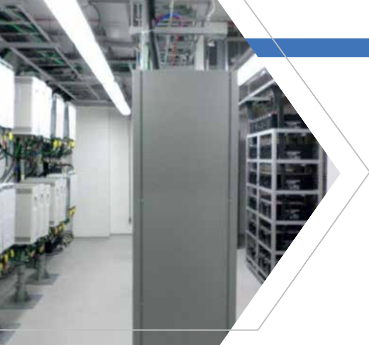
Ambiente das operadoras

Sala para abrigar equipamentos de várias operadoras com infraestrutura completa e compartilhada, incluindo: energia AC, energia CC, climatização, controle de acesso, CFTV, sistema de detecção pontual e precoce, alarme de incêndio, combate automático com gás inerte e sistema de automação predial. Atende até quatro operadoras.