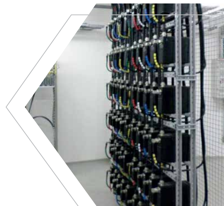
Rack de atenuadores